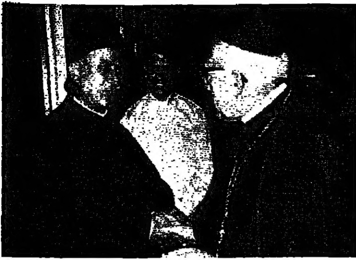
المطران خرغام والسفير الياباني في الكاتدرائية المارونية في مصر الجديدة.

المرميين يزور هذه الرعية مرتين في السنة بمناسبة عيدي الميلاد والفصح في أفريقيا